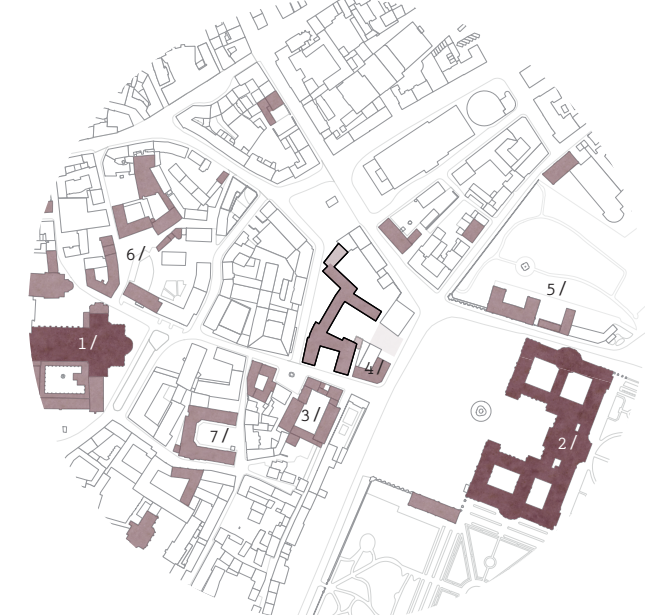
/ Denkmalgeschützte Gebäude