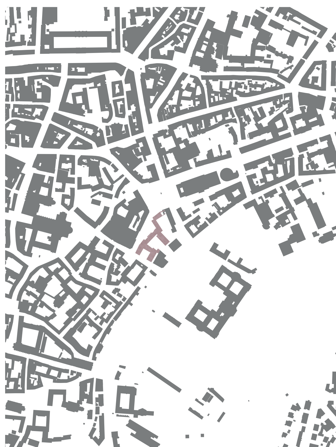
Schwarzpl M 1-5000