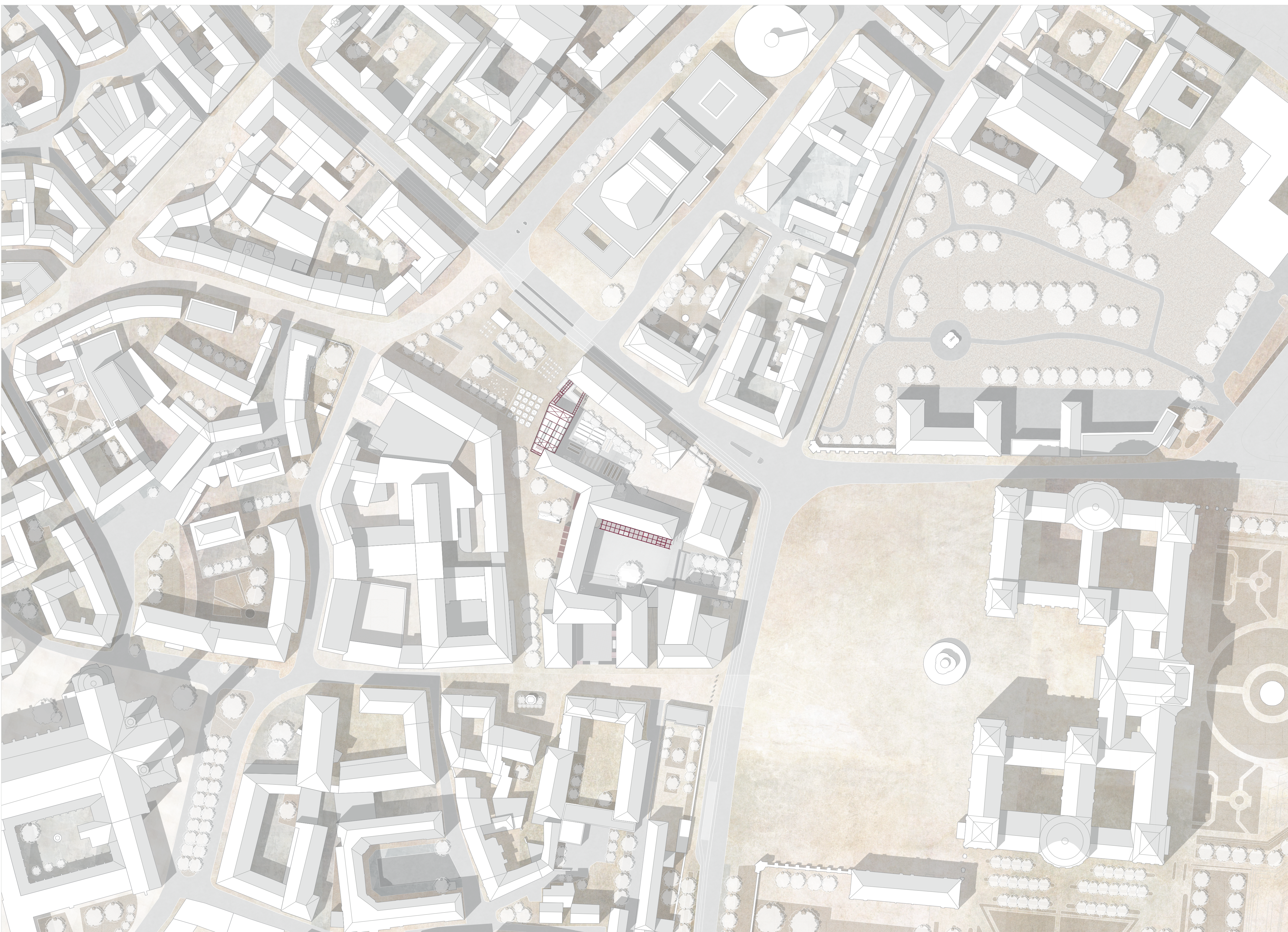
Lageplan M 1:500

Ziel: / Management zur nachhaltigen Umgestaltung des ehemaligen Mozartareal zum Main Hub