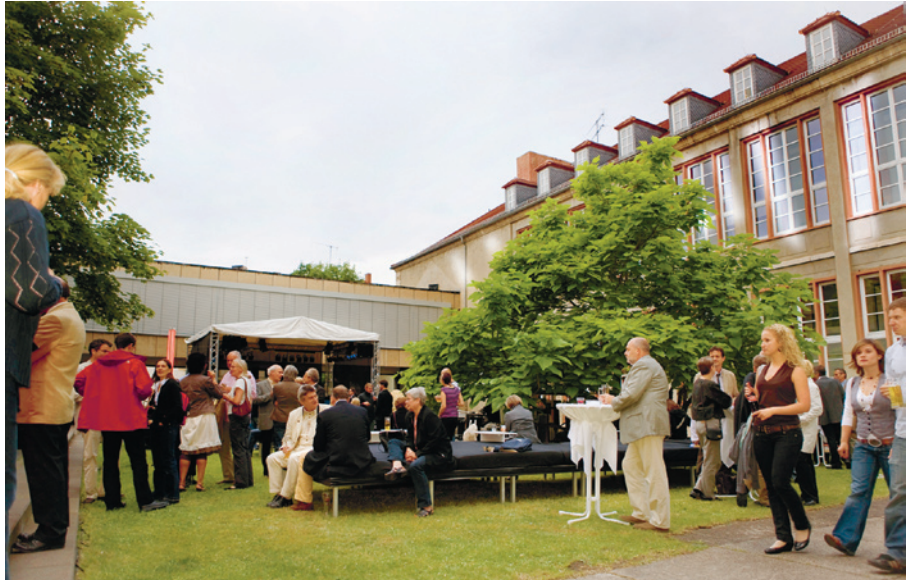
(ra) Die Bauhaus-Universität und die Hochschule für Musik FRANZ LISZT feierten am 20. Juni 2008 rund um und in der Mensa am Park ihr drittes gemeinsames Sommerfest »Bauhaus meets Liszt« und entführten ihre Gäste vom Tag in die Nacht, vom Licht ins Dunkel, mit Musik, Tanz und einer reich gedeckten Tafel.