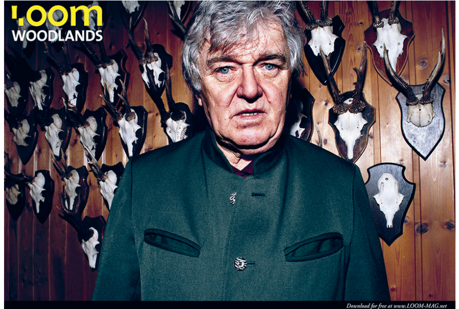
Cover Loom »Woodlands«, Foto von Henriette Kriese