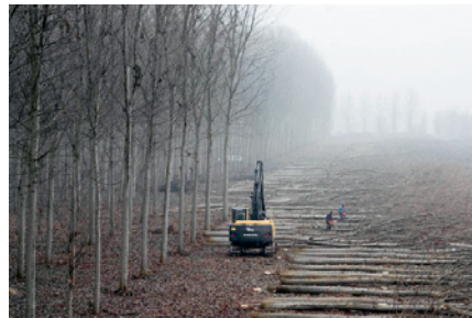
Populus Populi