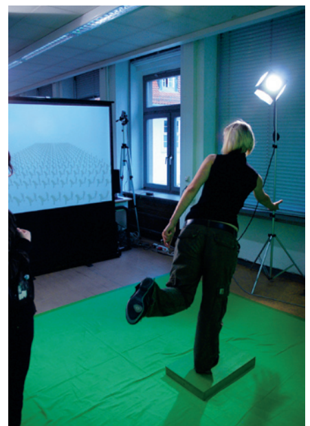
Ausstellungen und Installationen der Mediengestaltung in der Marienstraße 5.