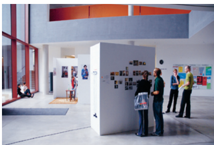
Die Ausstellung des Preises der Mediengestaltung im unteren Foyer der Universitätsbibliothek.