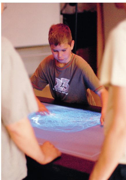
Besucher der Präsentationen des Studiengangs Mediensysteme in der Bauhausstraße 11.

Was die Menschen der Fakultät Medien alles mit Medien schaffen, gestalten und entwickeln, das zeigten sie vom 10. bis 13. Juli 2008 zum Mediengang 08 einer interessierten Öffentlichkeit. Die Besucher erhielten ein Wochenende lang Einblick in die Ateliers, Labore, Werkstätten und Projekträume. Neben den Ausstellungen bot der Mediengang 08 eine ganze Reihe von einmalig stattfindenden Veranstaltungen: Vortragsreihen, Filmvorführungen oder Performances.