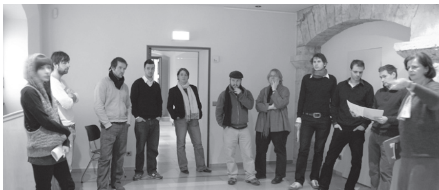
Im Souterrain des Neuen Museums erhält das universitäre Schaufenster seinen Platz.

Geplant ist eine ständige Ausstellungsfläche für studentische Arbeiten, Alumni-Präsentationen und Hochschulkooperationen. Zudem werden gemeinsame Projekte mit dem Archiv der Moderne und der Klassik Stiftung Weimar angestrebt.