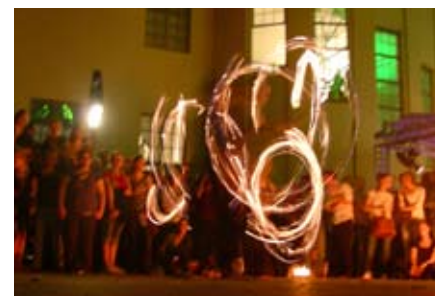
Eine furiose Feuershow bildete den Abschluss der Opening summary.