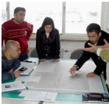
KNOTEN WEIMAR GmbH

Der englischsprachige, internetbasierte Weiterbildungsstudiengang EEM ist akkreditiert worden und ab dem Wintersemester 2008/2009 als Masterkurs (M.Sc.) an der Bauhaus-Universität Weimar. In diesem Fernstudiengang werden Ingenieure für den internationalen Markt ausgebildet, die im Bereich Umweltmanagement u.a. für die Planungskonzepte, das Stoffstrommanagement und die Prozesstechnik verantwortlich sind. Trainiert werden fachübergreifend vernetztes Denken, Detailwissen in den Grundlagen, ökologische, ökonomische und soziale Kompetenz. Der Studiengang wird bereits erfolgreich als Zertifikatskurs durchgeführt. Wesentliche Fachgebiete sind: Water Management and Resources; Waste Management Concepts, Landfill Technology, Hazardous Waste Management, Environmental Geotechnics, Emissions, Renewable Energy, Hydraulic Engineering, Transportation, Waste Water Treatment. Die Studienbetreuung und -organisation obliegt der KNOTEN WEIMAR GmbH. Zugangsvoraussetzungen und Details finden sie unter: