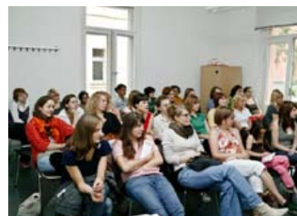
Ein Forum ermöglichte viele Fragen zum Einstieg ins Berufsleben