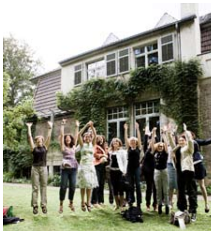
Das Haus Hohe Pappeln inspirierte ...

Zudem arbeiteten zahlreiche Teilnehmer im Salsa-Workshop an ihrem Hüftschwung oder probierten sich als Radiomacher. Wieder andere experimentierten im Workshop »Meine Stimme, deine Stimme« oder aber im »Improvisationstheater«. Viele Wissbegierige nahmen an den Führungen der Klassik Stiftung zum Thema »Europa in Weimar« teil und nutzten den kostenfreien Eintritt in alle Museen.