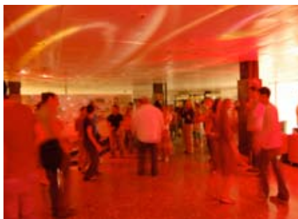
Eine ausgelassene Abschiedsparty

Interessantes zu Geschichte der Sommerakademie. www.uni-weimar.de/sommerakademie