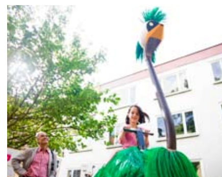
Der Roadrunner

dienstudenten, die am Sonnabend ihre Film- und Videobeiträge als »Medienrolle« im Audimax zeigten. »Großer Respekt an die Studenten!«, »Sehr gekonnte und gut organisierte Ausstellung.«, »Wir kommen wieder!« hörte man von vielen Gästen. Ähnliches Lob gab es nach dem gelungenen Eröffnungsfest. Der Publikumszuspruch variierte je nach Ausstellungsort und war von Freitag bis Sonnabend am größten. Auf ausgelegten Flyern konnten die Besucher ihre Eindrücke hinterlassen, bei den Architekten sogar die Favoriten unter den »best of« der ausgestellten studentischen Arbeiten mitwählen. Das größte Medienecho genoss das Aufwindkraftwerk, welches gemeinsam von Architektur- und Bauingenieurstudenten den Geist eines interdisziplinären Studiums an der Bauhaus-Universität fast idelotypisch verkörperte. Viel frischer Wind und noch mehr Ideen, genau dies wollte die »summary 08« in die Welt tragen.