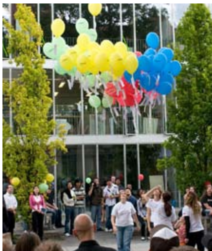
Zur Eröffnung der summary stiegen über 100 Ballons mit Projektkarten in die Luft.

Die Geschäftigkeit bis zum Eröffnungstermin kannte kaum Grenzen, überall wurde letzte Hand angelegt, um die Öffentlichkeit zu begeistern. Wie in den Jahren zuvor luden die Architekten zur »Werkschau« und die Bauingenieure zur »Bautour« ein. Der »Rundgang« der Fakultät Gestaltung zeigte die meisten Kunstprojekte an verschiedenen Standorten und beim »Medien-gang« der Fakultät Medien präsentierte sich die Vielfalt der wissenschaftlichen, künstlerisch-gestalterischen und technologischen Medienstudiengänge.