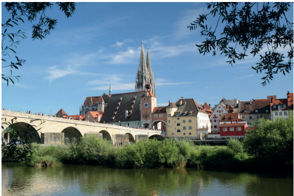
Stadtpanorama Regensburg

Regensburg und Augsburg gehörten zu den bedeutenden europäischen Handelsstädten zwischen Italien, Böhmen, Russland und Byzanz. Dies ermöglichte einen vielfältigen Austausch kultureller und architektonischer Einflüsse, die das Bild beider Städte bis heute prägen.