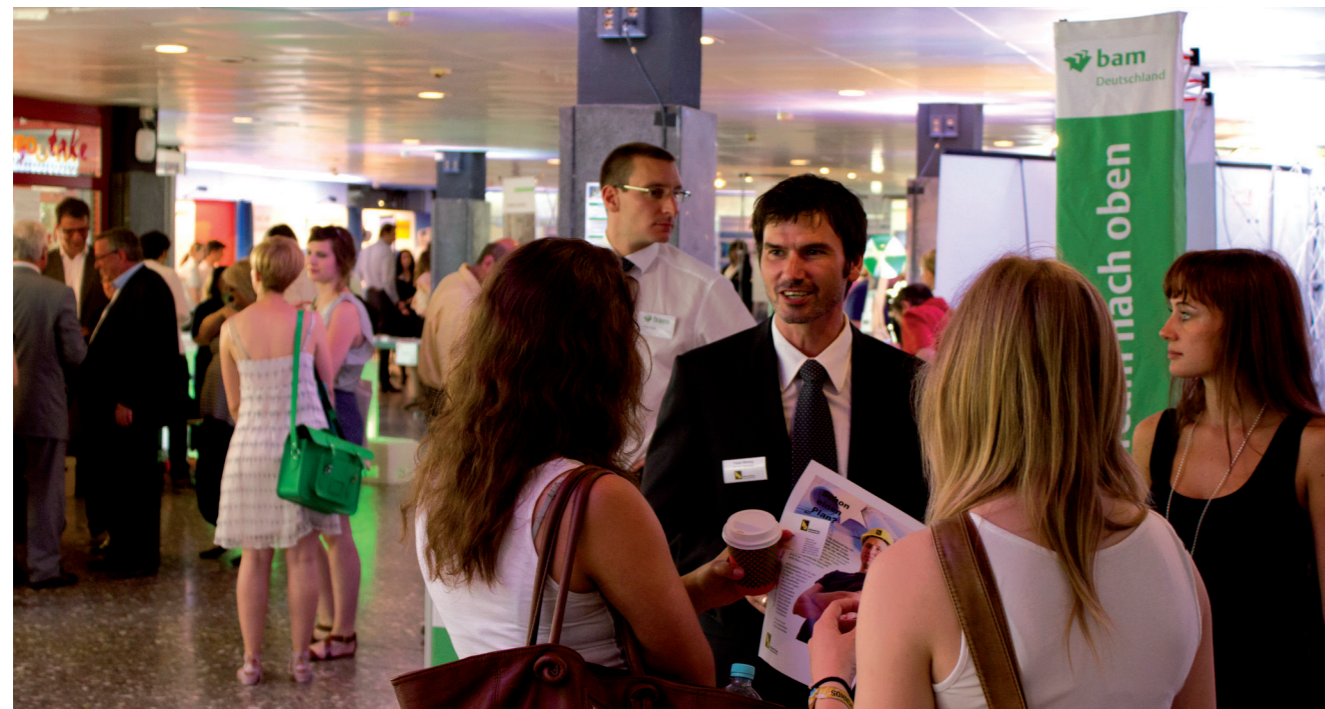
Buntes Treiben bei der Firmenkontaktmesse im Foyer der Mensa

Wir laden alle Studierenden, Absolventinnen und Absolventen herzlich ein, beim Karrieretag Weimar dabei zu sein. Nutzen Sie diesen Tag, um Kontakte zu knüpfen und sich über Unternehmen und Karrieremöglichkeiten zu informieren. Wir freuen uns auf Sie!