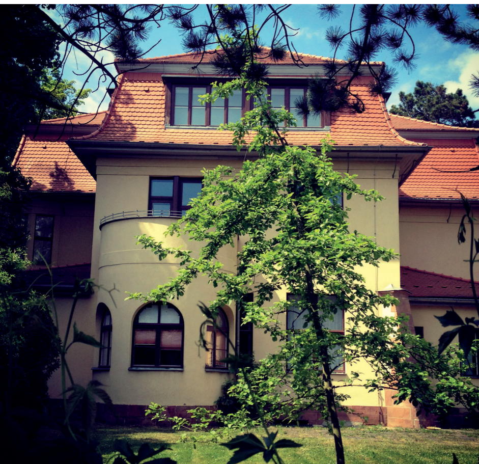
Gründungsvilla in der Helmholtzstraße 15

Mehr Informationen dazu gibt es auf www.neudeli.net