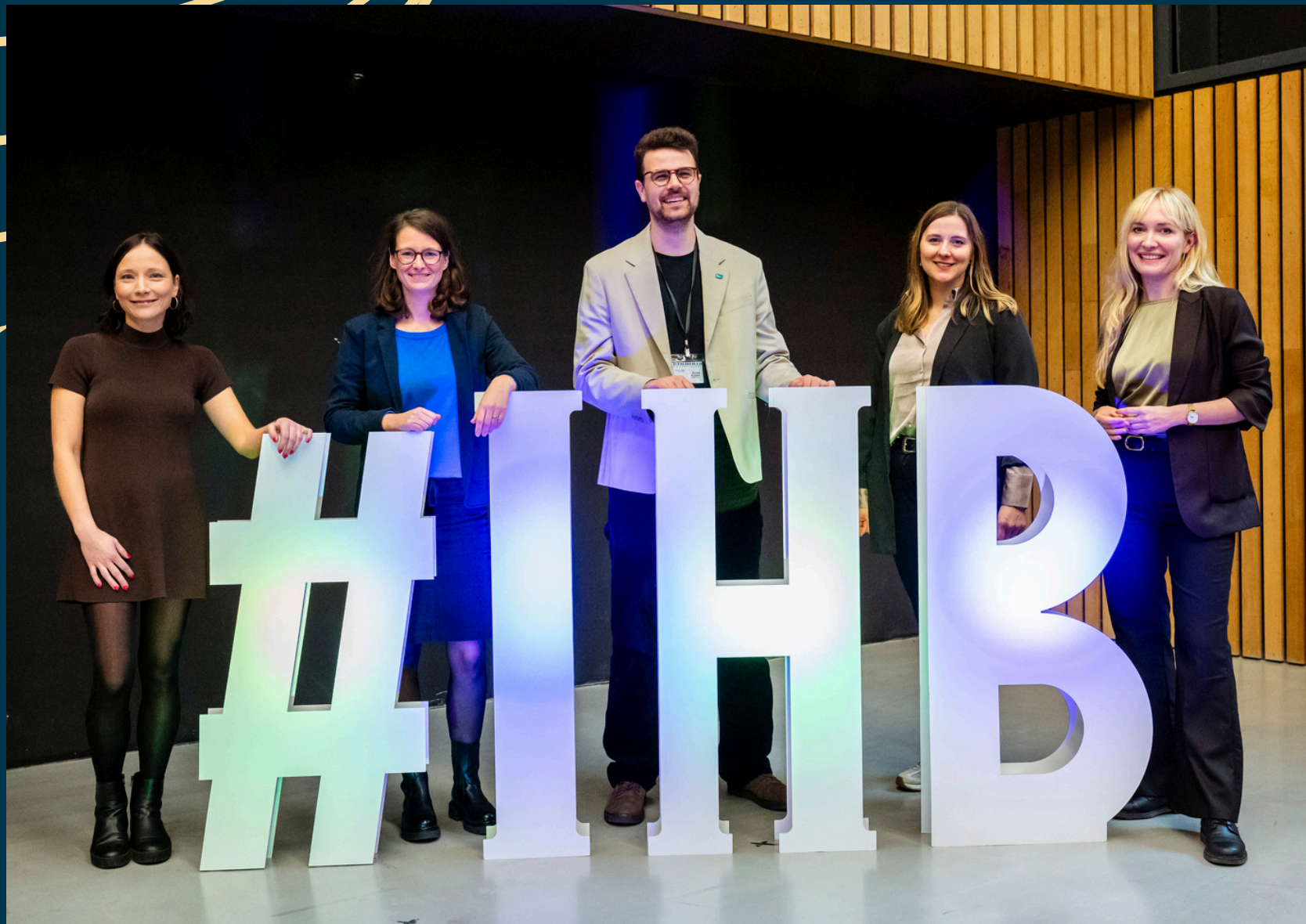
Das neudeli Team beim Innovators Homecoming 2025

ein ereignisreiches Jahr liegt hinter uns!