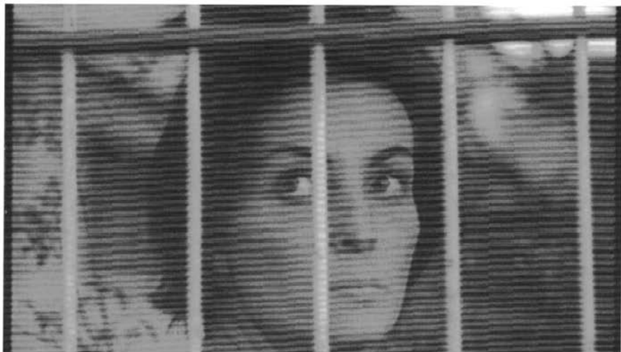
2 L'Eclisse , I/F 1962; Liebe 1962/Sonnenfinsternis , Regie: Michelangelo Antonioni

dezu geistesabwesend, mit nach innen gerichteten Augen einem Gedanken oder Gefühl nachsinnend. Ihr auffälliges vor sich hin Starren kann deshalb als Ausdruck der inneren Ekstase gedeutet werden, die die Kehrseite der Eklipse des Augenblicks darstellt. Häufig zeigt die Kamera ihren Hinterkopf in Großaufnahme – als gäbe ihr Gesicht nichts zu lesen. Das Blond ihres fülligen Haarschopfs, ein einziger leuchtender Fleck, füllt dann die Mitte des Bildkaders aus und dirigiert die Kamera. Antonionis Film erscheint so gesehen geradezu als Paradebeispiel einer negativen Ekstase, für die symbolisch Kälte und Dunkelheit der Sonnenfinsternis des Filmtitels stehen. Doch gerade in der Unmöglichkeit von Liebe, der unerfüllbaren Sehnsucht danach, liegt ein ekstatisches Moment des Films. Wie Fellinis Casanova deutlich gemacht hat, treibt erst die Maßlosigkeit des Wünschens die Ekstase hervor.