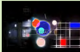
Legacy, RDV Collectif