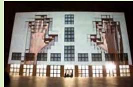
555 Kubik, Urbanscreen