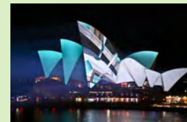
Sydney Opera, Urbanscreen