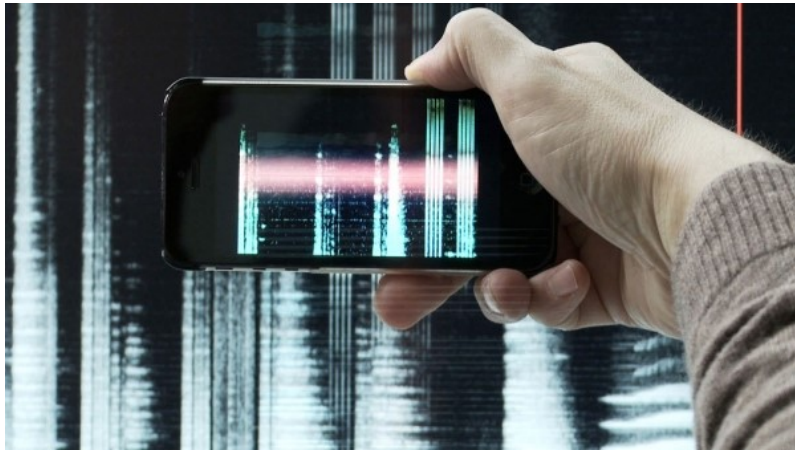
Peter Weibel, The Origin of Noise – The Noise of the Origin , 3-D Performance-Oper, Karlsruhe, 2013, Foto: © ZKM | Karlsruhe