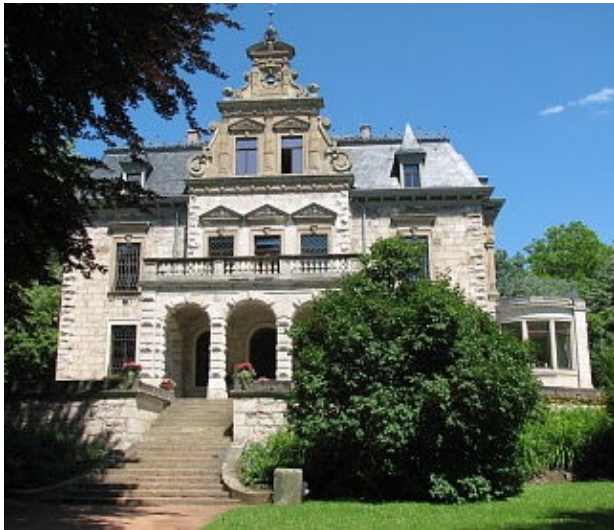
Villa Haar im Park an der Ilm in Weimar

Sehr geehrte Freundinnen und Freunde des Instituts für Konstruktiven Ingenieurbau der Bauhaus-Universität Weimar!