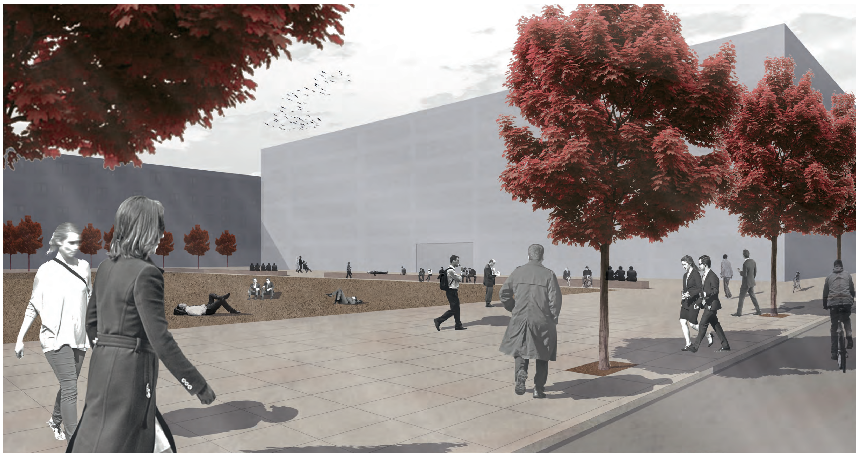
PERSPEKTIVE BEREICH ARBEITEN/WOHNEN