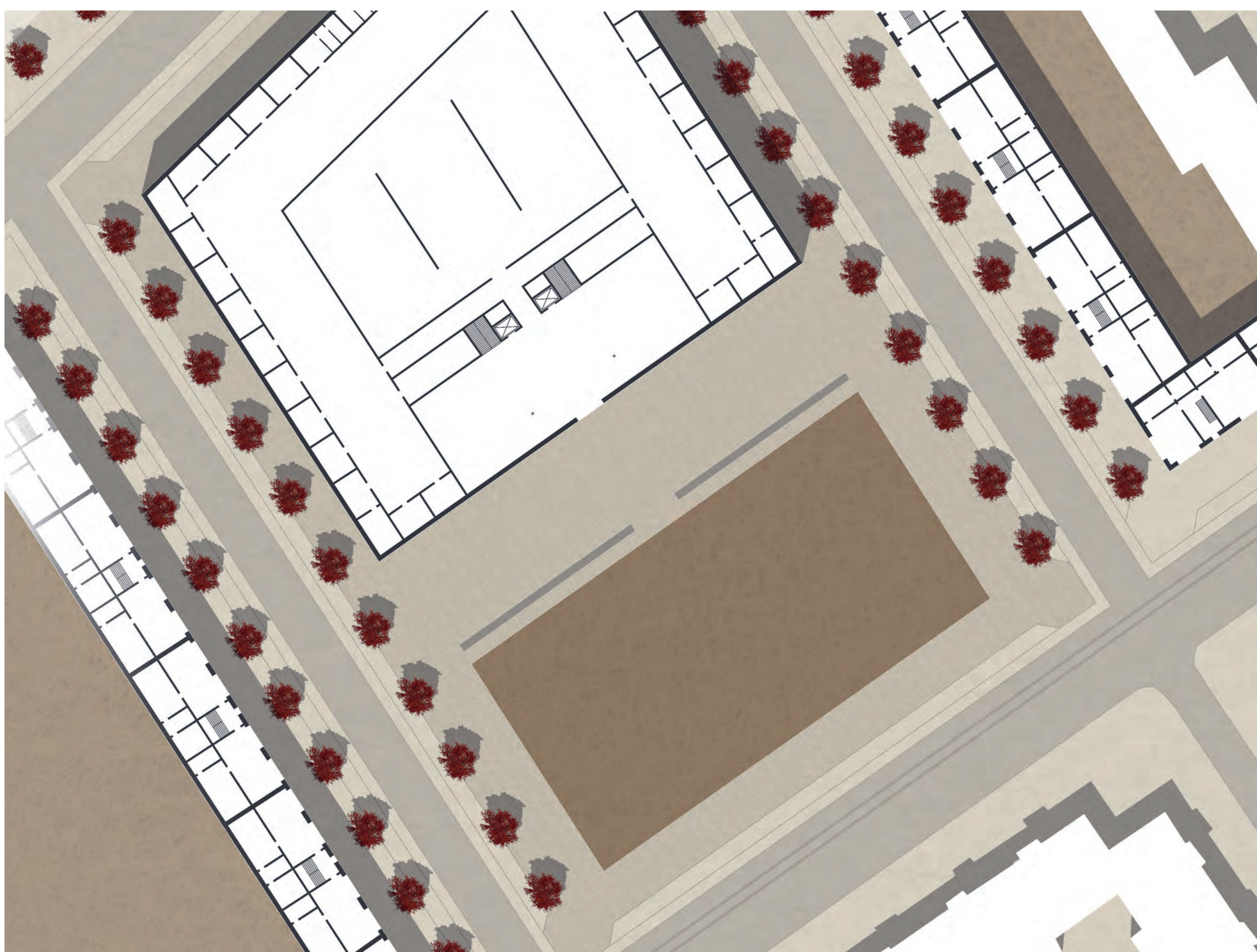
LAGEPLANAUSSCHNITT BEREICH ARBEITEN/WOHNEN M 1:500