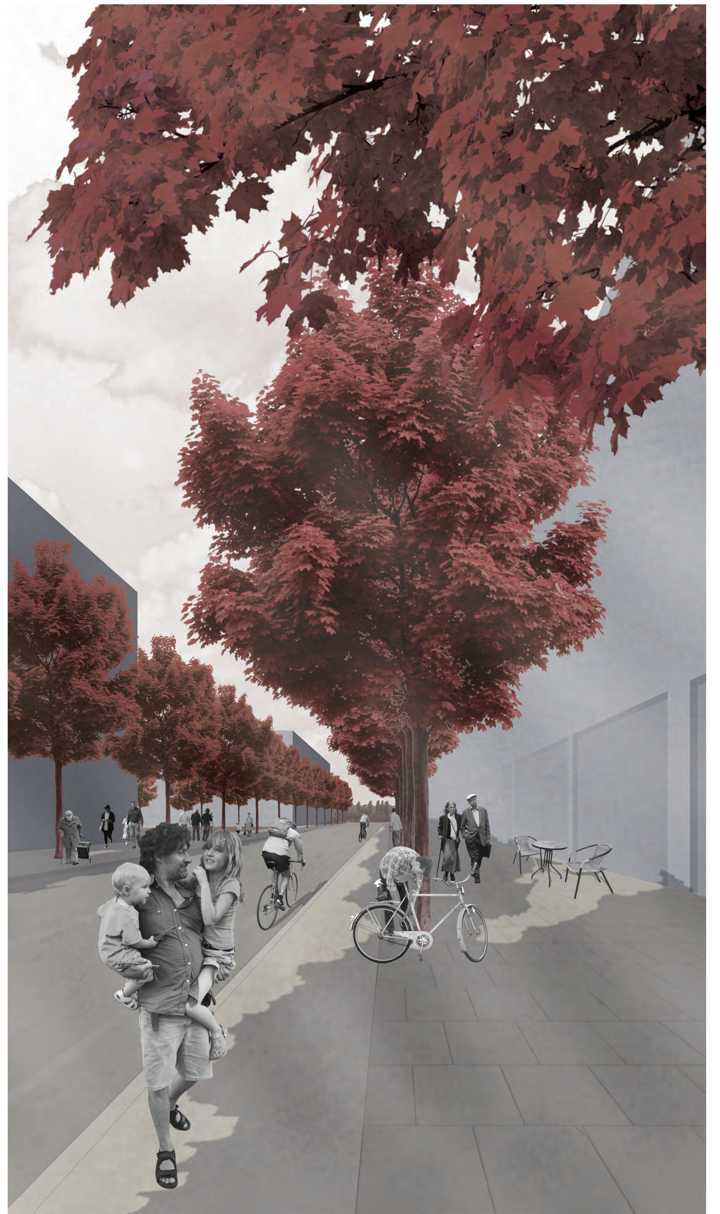
PERSPEKTIVE BEREICH WOHNEN