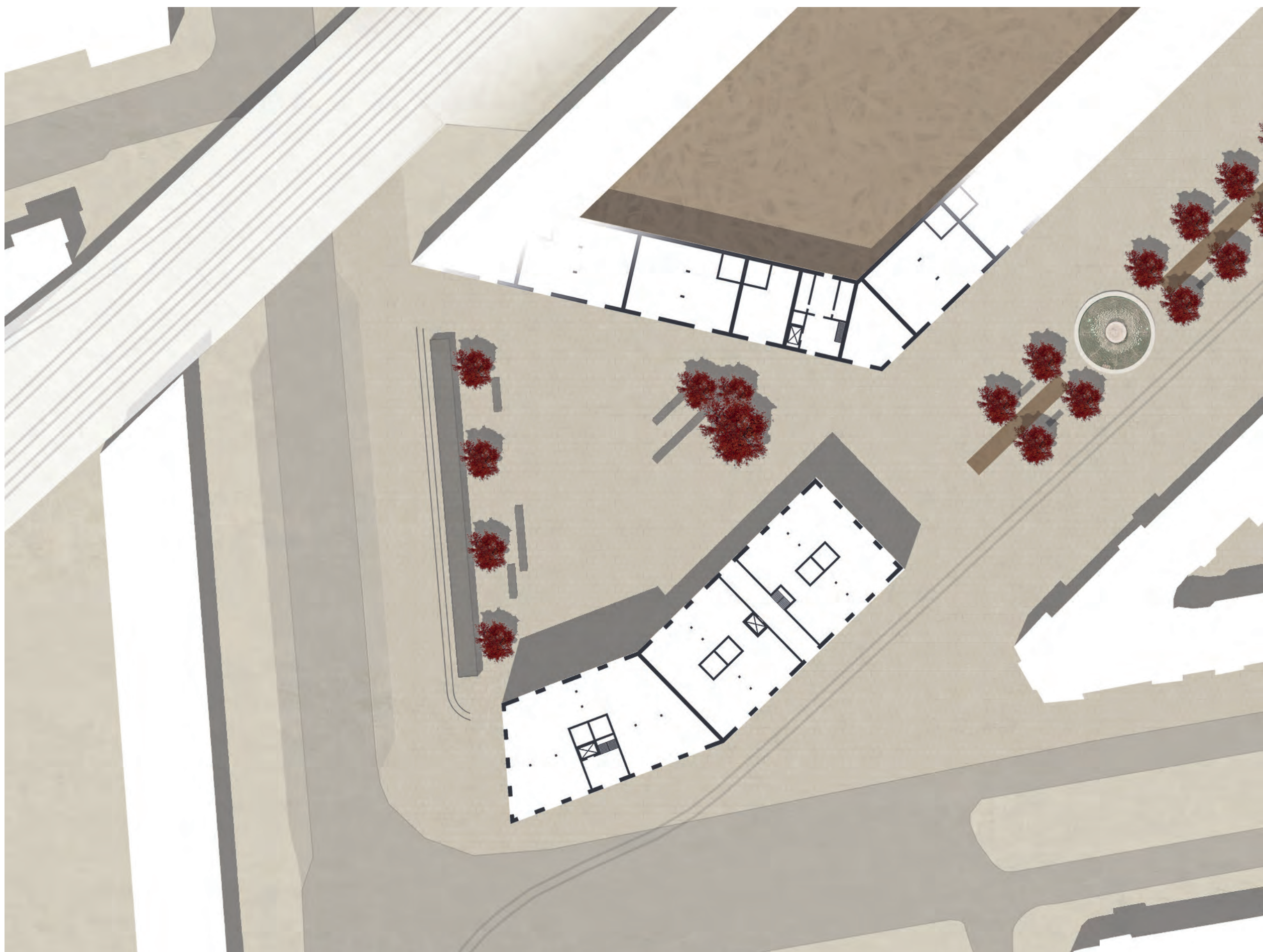
LAGEPLANAUSSCHNITT BEREICH ZENTRUM M 1:500