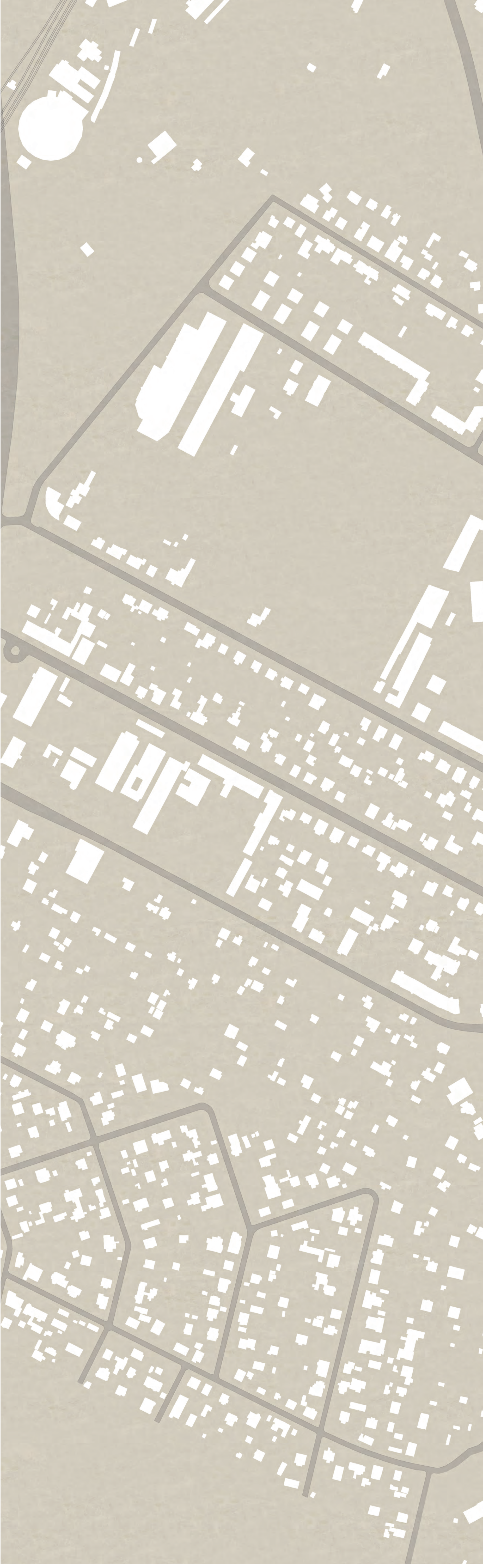
LAGEPLAN M 1:2000