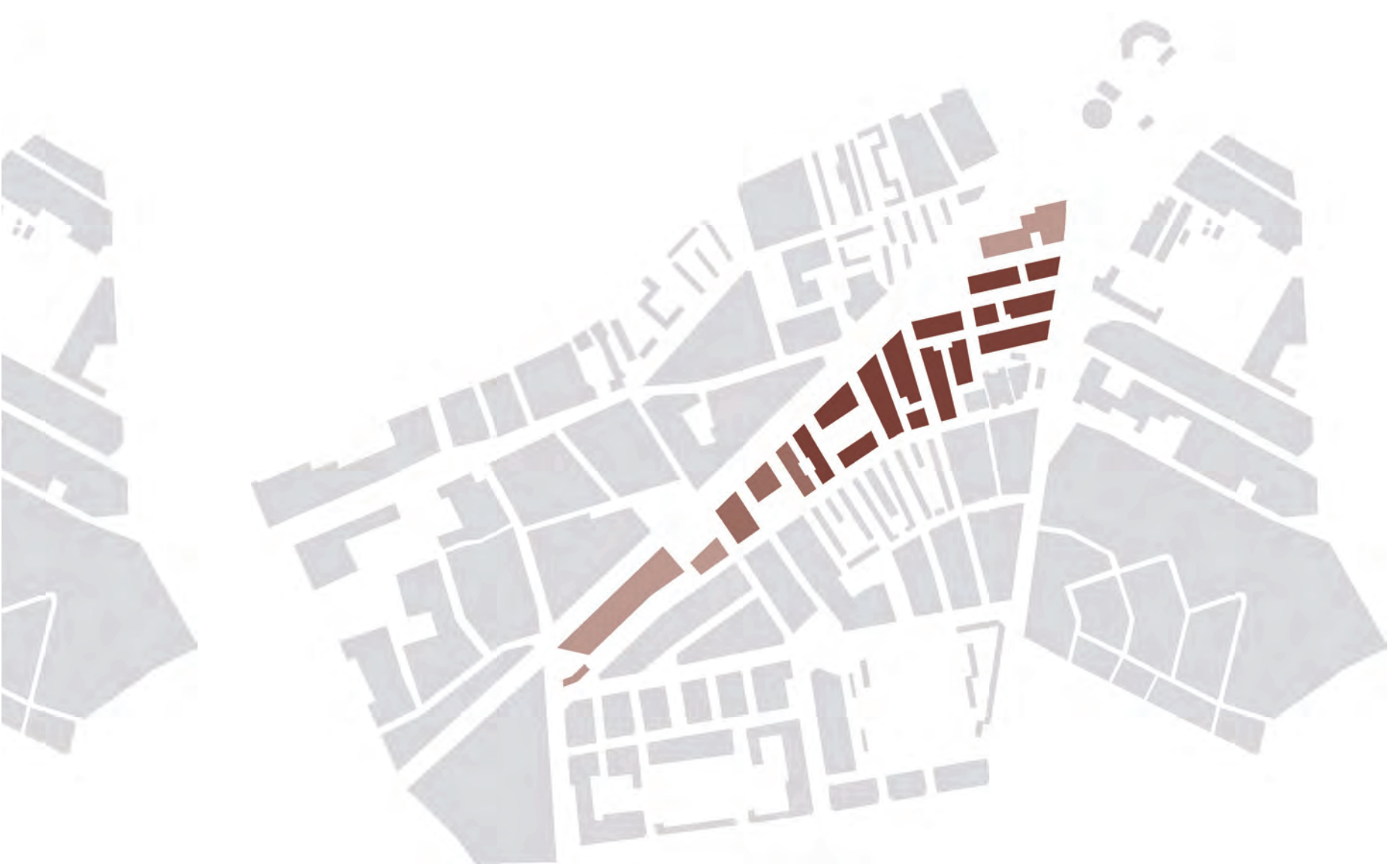
PRIVAT PLÄTZE ZENTRUM | WOHNEN/ARBEITEN | WOHNEN KONZEPTDIAGRAMME