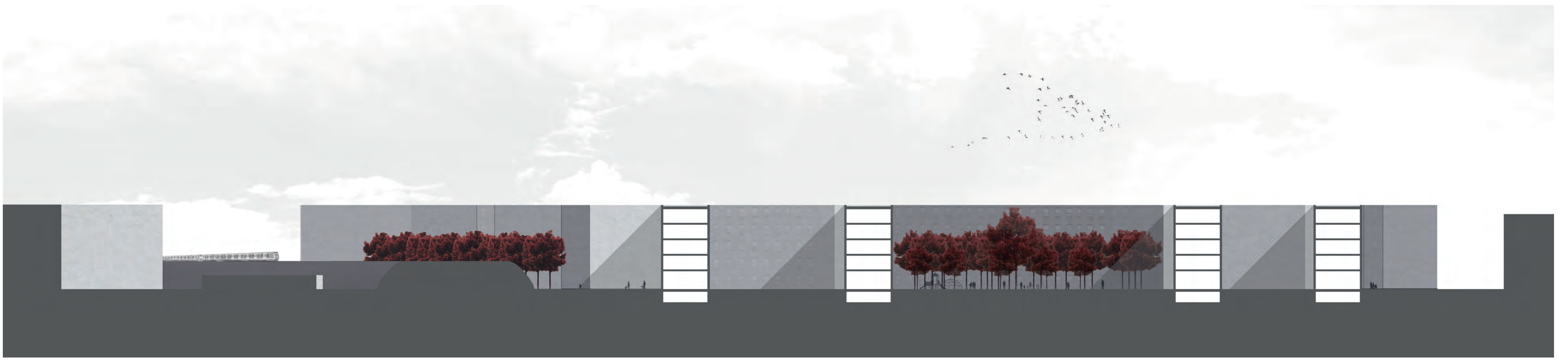
GELÄNDESCHNITT M 1:500