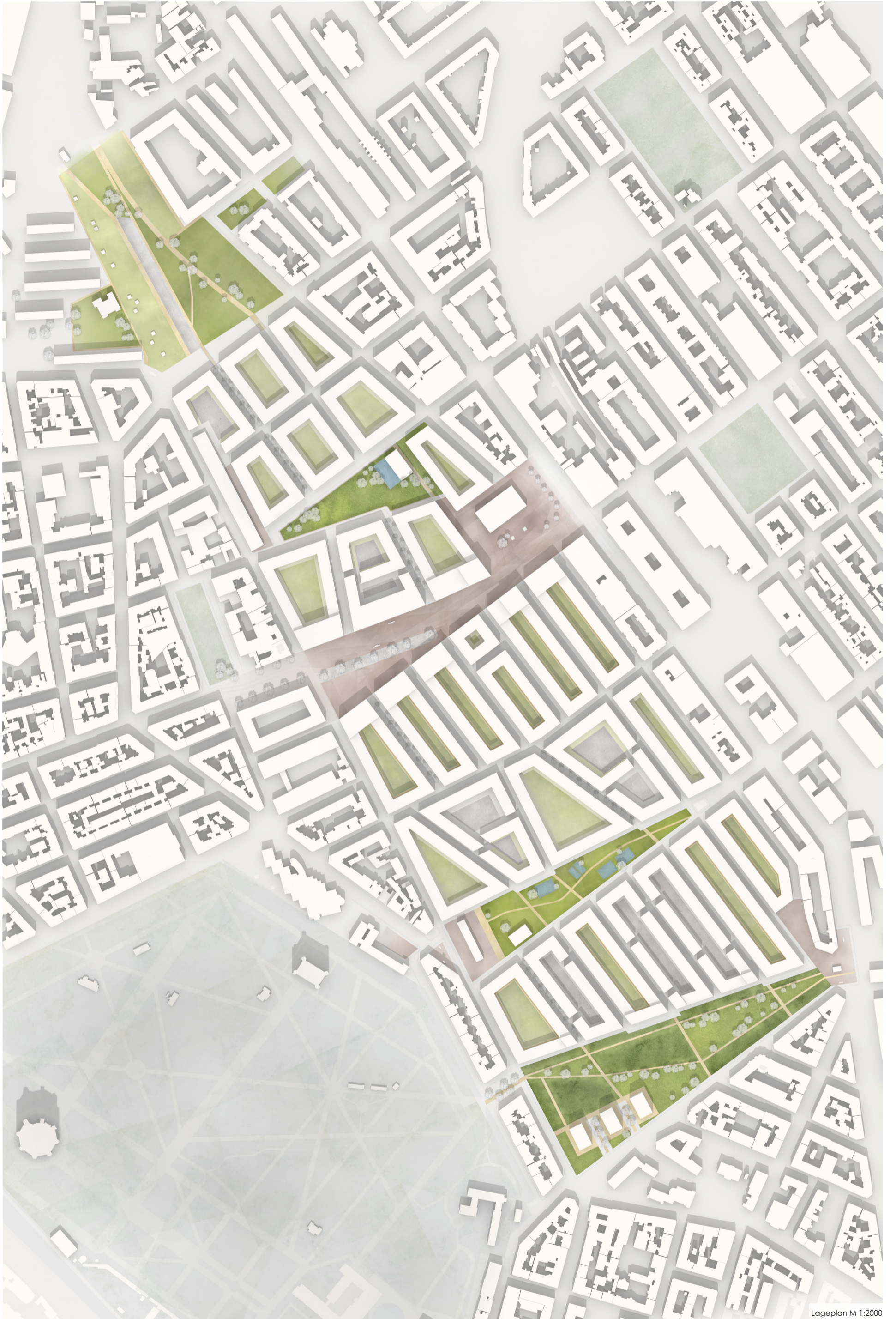
Logeplan M 1:2000