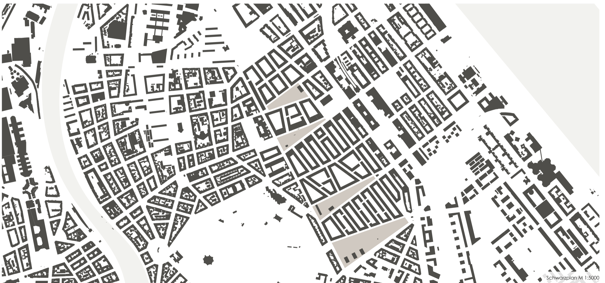
Schwarzplan M 1:5000