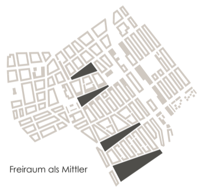
Freiraum als Mittler