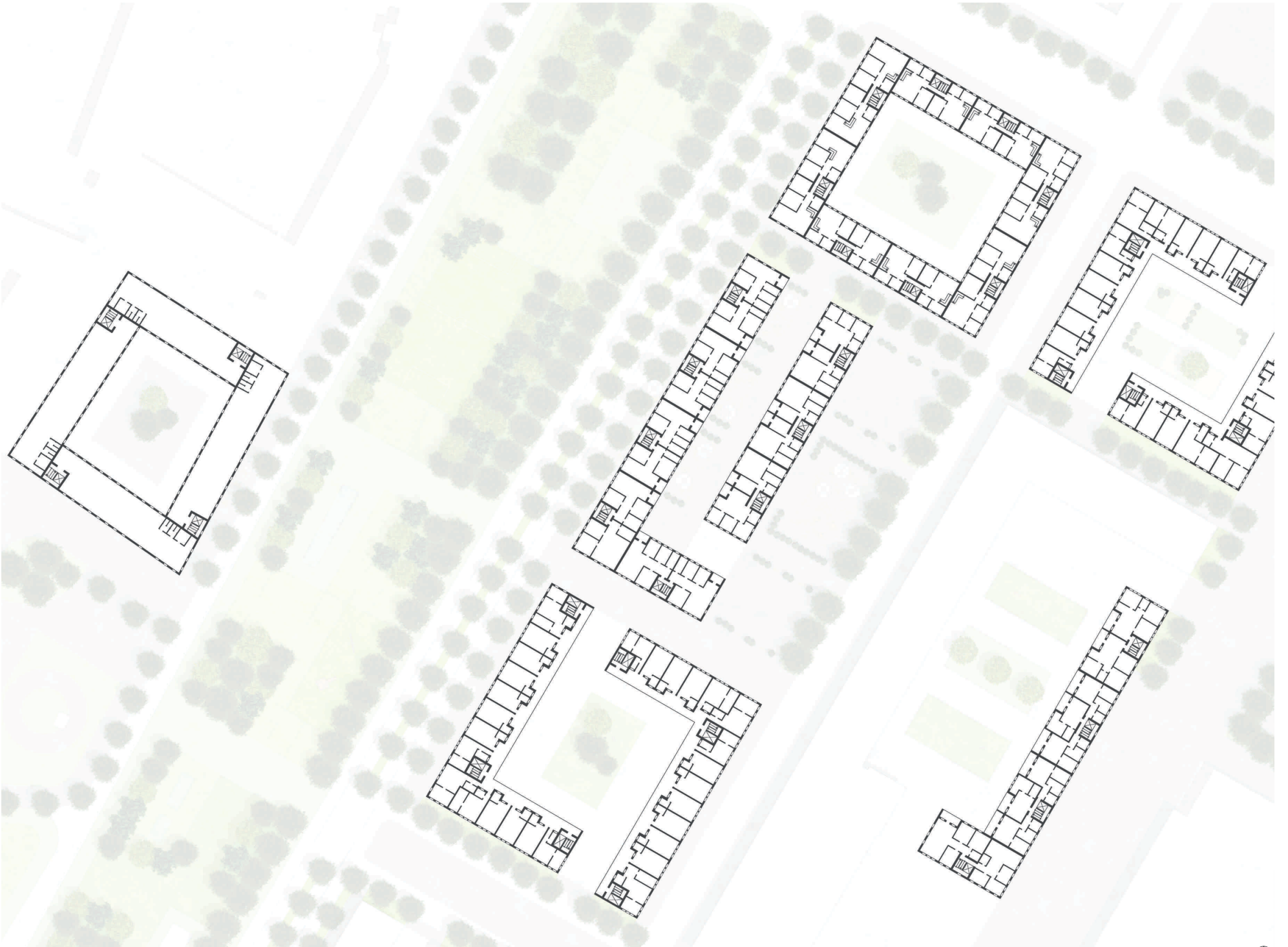
GRUNDRISSE 2.OBERGESCHOSS M 1:500