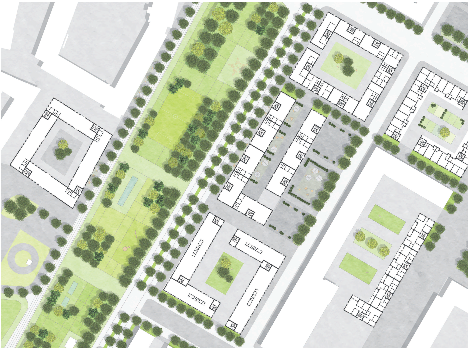
GRUNDRISS ERDGESCHOSS M 1:500