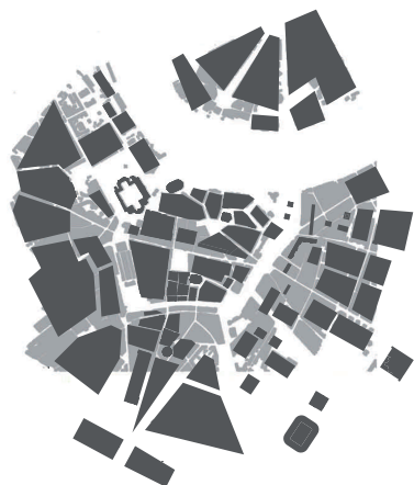
HISTORISCHE VORSTADTKANTE VON 1945