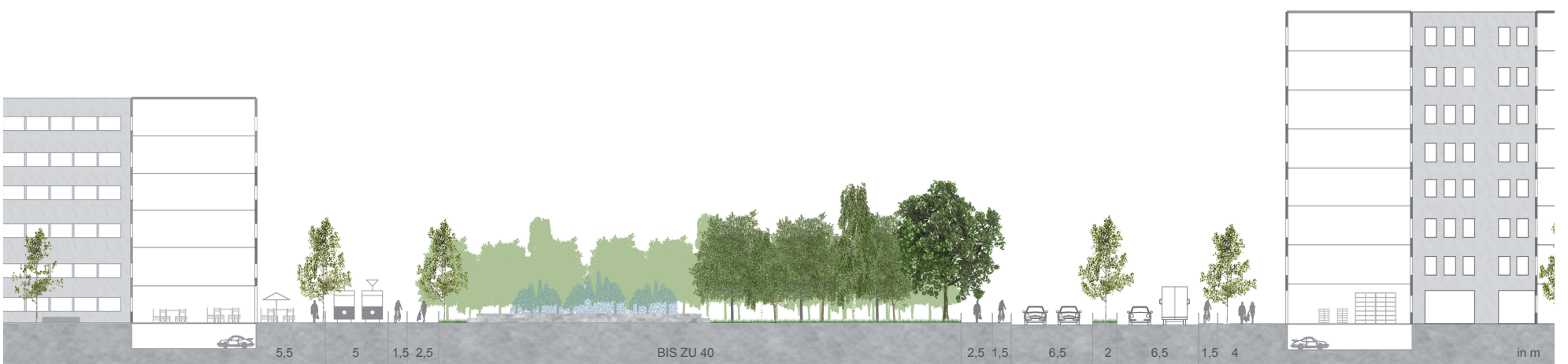
QUERSCHNITT M 1:200