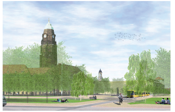
BLICK RICHTUNG RATHAUSPLATZ IM ENTWURF