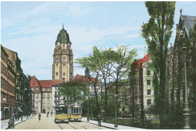
BLICK RICHTUNG RATHAUSPLATZ 1913