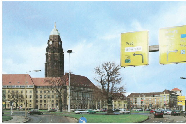
BLICK RICHTUNG RATHAUSPLATZ 1994