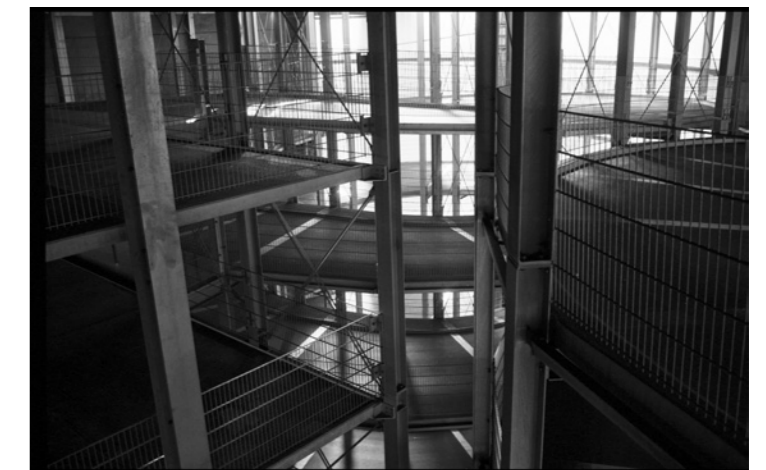
Parkhaus Berlin