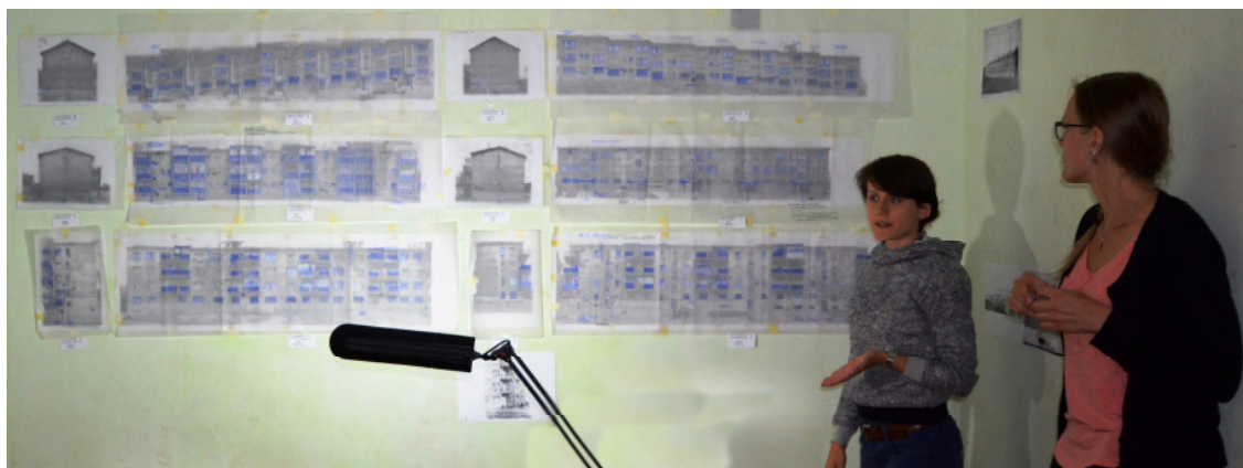
Abb. 6 Besprechung im Workshop - anhand von fotografischen Fassadenabwicklungen der Hauszeilen des Wohnkomplexes

Möglichkeiten der Verknüpfung des Wohnens mit dem Freiraum waren Ausgangspunkte der den Workshop abschließenden Entwurfsstudien.