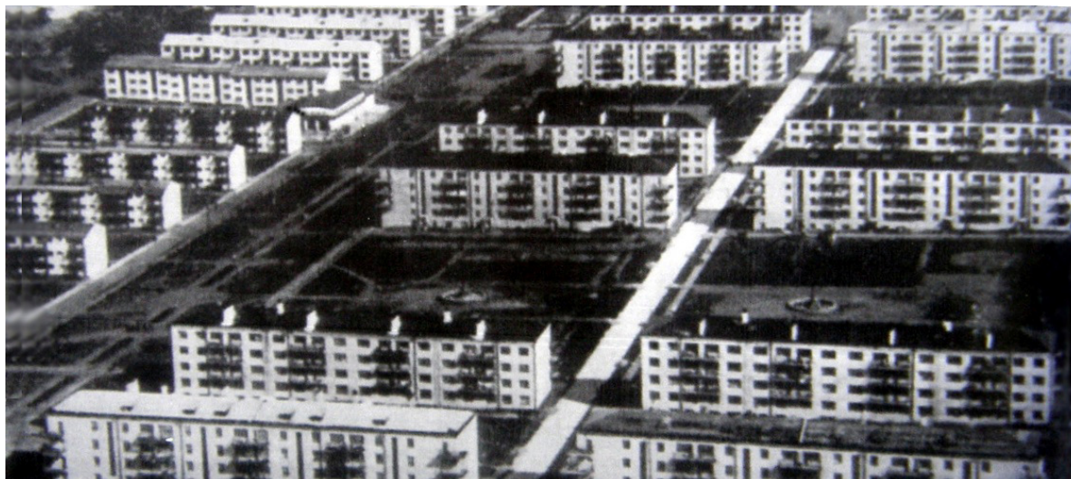
Abb. 1 Blick auf das Zentrum des Ersten Wohnkomplexes der Sozgorod Magnitogorsk, err. 1930-1934

Magnitogorsk im südlichen Ural ist eine sozialistische Stadtgründung. Die Errichtung des damals weltgrößten Metallurgischen Werkes war 1929 der Startpunkt der Stadtentfaltung. Zu Gunsten des Aufbaues des Werkes mussten die immer zahlreicher werdenden Neu-Magnitogorsker vorerst mit Erdhöhlen, Zelten und Baracken als Wohnort vorlieb nehmen. Trotz der realen Not, entspann sich um die Frage, wie die Wohnstadt aussehen solle, eine der grundlegenden urbanistischen Debatten der Zwischenkriegszeit: die Frage nach einer völlig neuartigen sozialistischen Lebensform. Der Wettbewerb, der die Sozgorod-Idee an Magnitogorsk exemplifizieren sollte, blieb vor Ort weitgehend folgenlos. Schließlich bekam die seit Ende 1930 in Moskau tätige Gruppe um den ehemaligen Frankfurter Stadtbaurat Ernst May den Generalplan und die Ausführung anvertraut (Abb. 1).