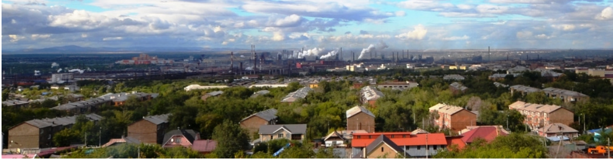
Abb. 2 Blick von Süden auf den Wohnkomplex heute