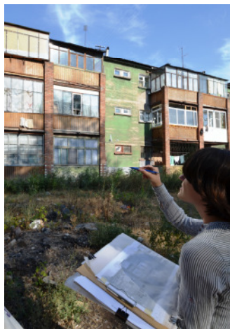
Abb. 4 Weimarer Studierende bei der Baudokumentation