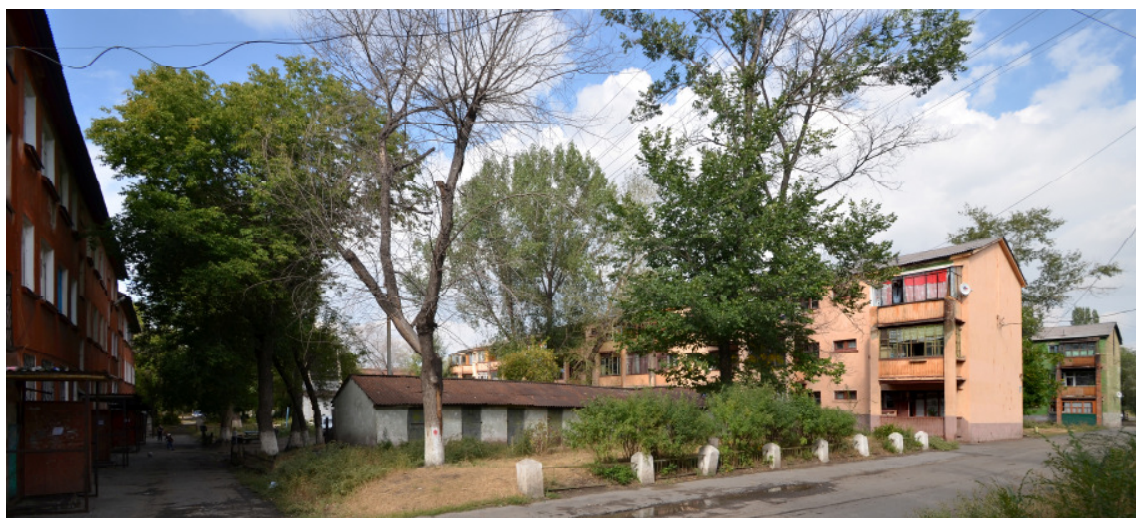
Abb. 7 Die Hauszeilen und deren Zwischenräume an der Majakowskaya Ul., err. 1930/31

Neben den direkt an die Wohnhausbauten anschließenden Bereichen wurde der gesamte Siedlungsfreiraum - Grünflächen, Plätze, Wege und Straßen von öffentlichem und halböffentlichem Charakter - als Handlungsfeld des Workshops betrachtet. Auf Grundlage vorhandenen Lageplanmaterials wurde das gesamte etwa 680 Meter mal 450 Meter messende Gelände hinsichtlich von Mängeln und Problemen analysiert und es wurden diese kartiert. Die Planungen der Gruppe May hierfür waren nicht mehr zur Ausführung gelangt. Anstelle der kleinteilig geplanten Strukturen mit Mietergärten und überschaubarem Gemeinschaftsgrün waren hier unter sowjetischer Regie repräsentative, neobarocke Schmuckanlagen entstanden. Auch deren Ausstattung mit Zierbrunnen, antikisierenden Plastiken und Vasen dokumentiert bis heute den doktrinären baupolitischen Richtungswechsel in der Sowjetunion Mitte der 1930er Jahre.