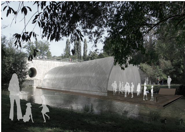
Abb. 03. Perspektive am Tag