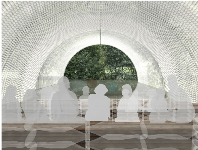
Abb. 01. Innenraumperspektive mit naturellen Bühnebild