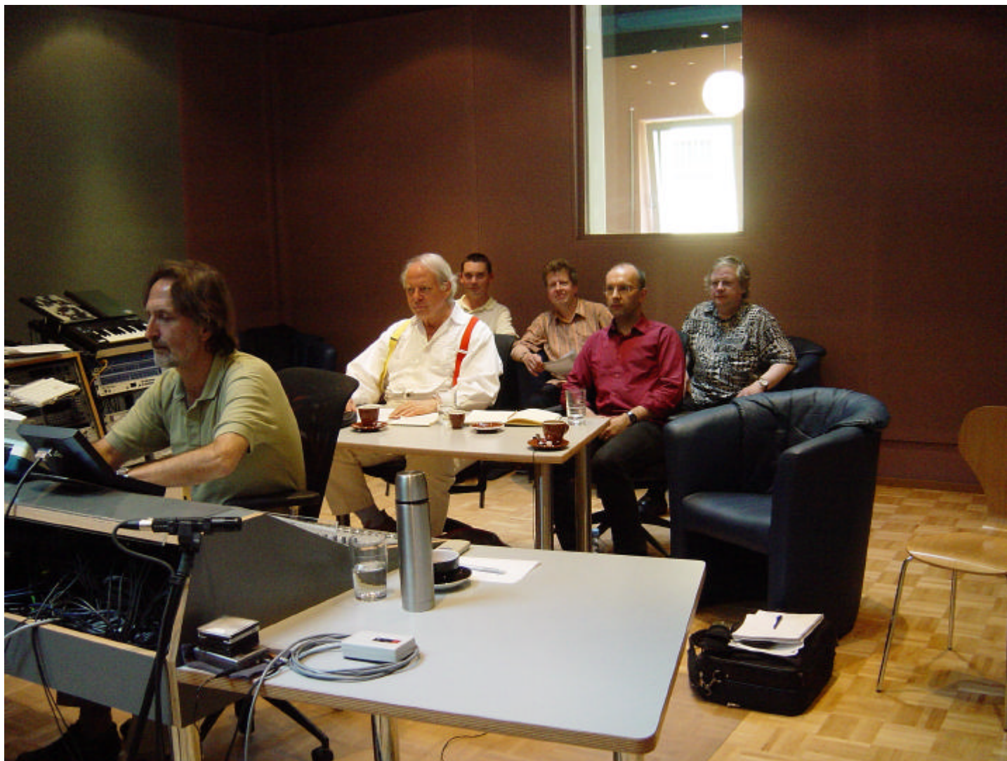
Karlheinz Stockhausen (76) im Mai 2005