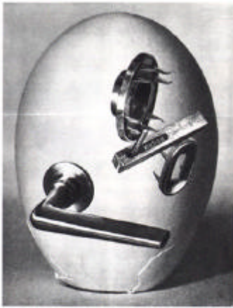
Burchartz, Wehag- Prospekt „Einheits- Türbeschlag“, 1930.