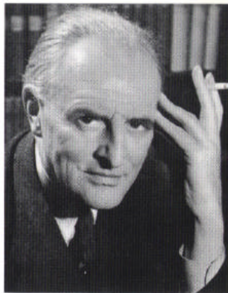
Max Burchartz, 1950er Jahre.

Ziel dieses Referates ist es, das Leben von Max Burchartz näher zu beleuchten und dabei besonders auf seine Zusammenarbeit mit der Fa. Wilhelm Engstfeld einzugehen.