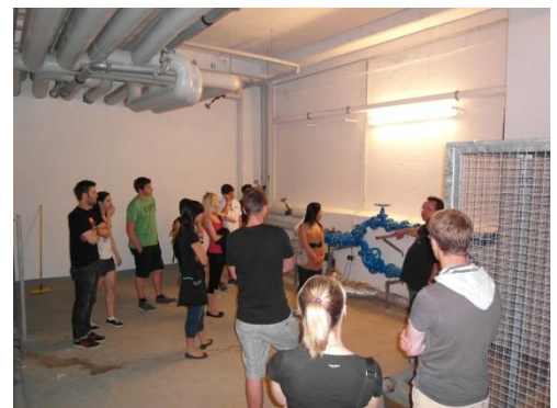
Besichtigung der Wasserversorgung

Die Teilnehmer konnten viele Elemente der Technischen Gebäudeausrüstung selbst inspizieren und den Gebäudebetrieb „live“ erleben. Die Komplexität aus den Anforderungen verschiedener Nutzer führte zu interessanten Diskussionen. In den Facility Management-Vorlesungen wurden die gewonnenen Erkenntnisse reflektiert und theoretisch fundiert.