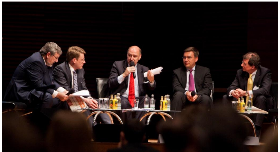
Podiumsdiskussion während des 11. Betriebswirtschaftlichen Symposiums Bau

Weitere Informationen finden Sie unter www.symposium-bau.de .